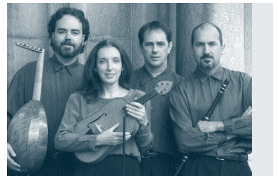
Ensemble Anonymus, 1998

Avec l'ampleur de l'implantation et la facilité d'accès de l'Internet, la création d'un site Web s'imposait pour la Compagnie