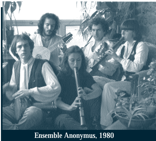
Ensemble Anonymus, 1980

Ainsi apprivoisé par Anonymus, l'héritage musical du Moyen Âge nous révèle son immense richesse et son esthétique propre. Des enregistrements de grande qualité, de nombreux spectacles et concerts témoignent autant du niveau d'accomplissement artistique atteint au fil des ans que du talent des musiciens qui y ont participé.